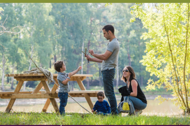
Étang de la Ribaloche dans la Forêt de Tours-Preuilly