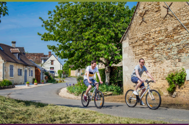
Les Gaillards à Bossay-sur-Claise