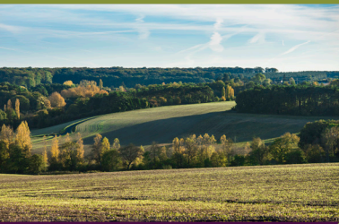
La Vallée de l'Indrois