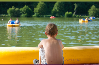
Base de Loisirs de Chemillé-sur-Indrois