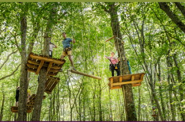
Parc aventure Clic'lac de Chemillé-sur-Indrois

« Il n'y a pas le feu au lac! » Alors prenez le temps de profiter du plan d'eau de 35 ha de Chemillé-sur-Indrois et des multiples activités qui y sont proposées (aires de jeux, pédalos, restauration, parcours aventure, baignade, etc.). L'étang du Pas-aux-Ânes vous attend quant à lui au cœur de la Forêt domaniale de Loches, pour un moment de détente. N'hésitez pas ensuite à prolonger le parcours pour découvrir les trésors de la chapelle romane du Liget, avec ses fresques et modillons sculptés, et ceux de la chartreuse du même nom, dont les vestiges montrent la richesse et l'influence de l'abbaye sous l'Ancien Régime. Un passage par le Château-Monastère de la Corroirie complètera la découverte de cet impressionnant ensemble architectural, entre forêt et étendues d'eau.