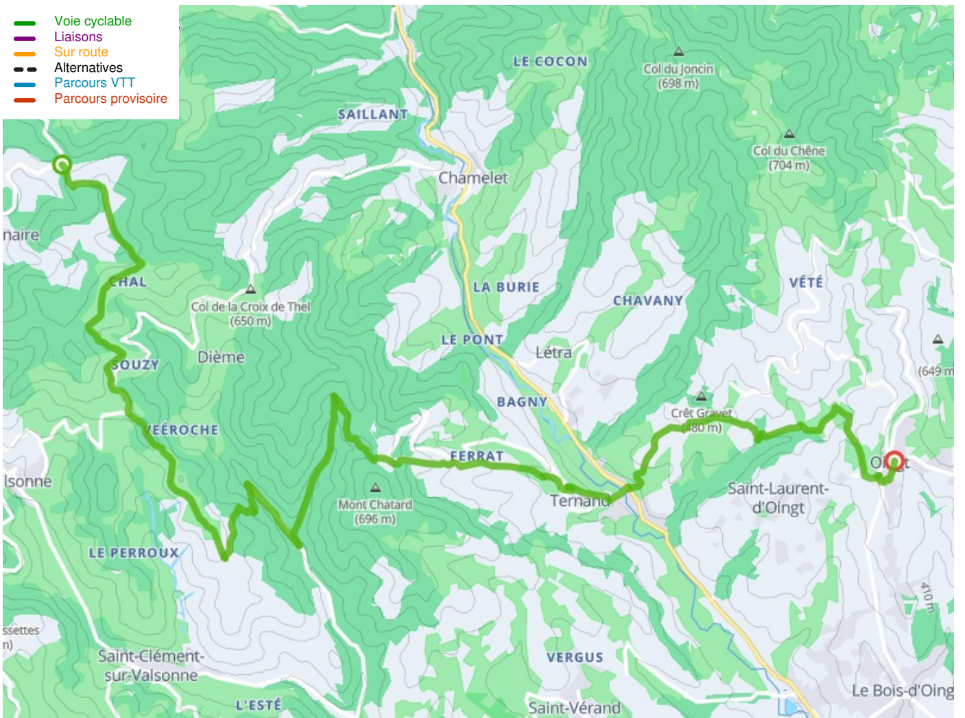
Départ Col de la Croix de l'Orme